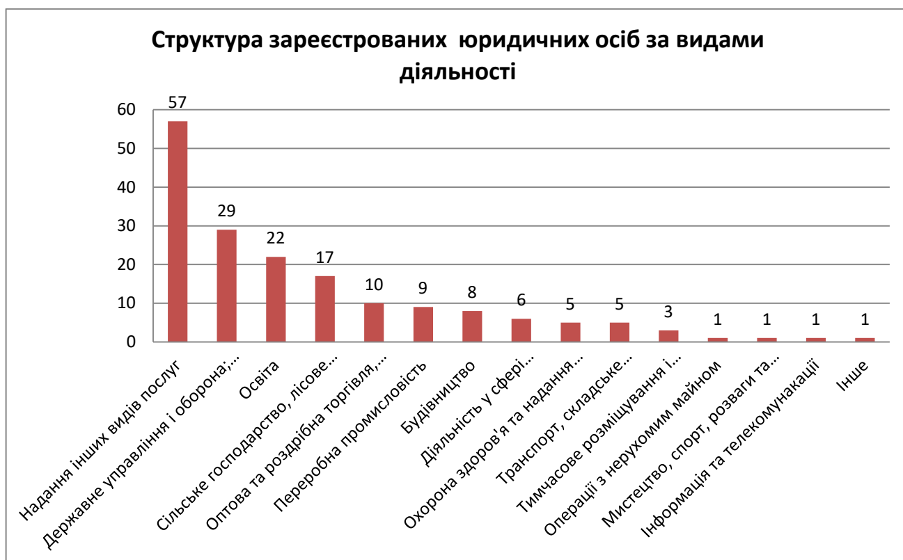
Рис.1. Структура за видами діяльності юридичних осіб на території Солотвинської селищної ради станом на 01.09.2025 року

Відповідно до інформації з аналітичної платформи Clarity Hromada створеною командою Clarity Project за підтримки USAID / UK aid проекту «Прозорість та підзвітність у державному управлінні та послугах / TAPAS» і за сприяння Міністерства цифрової трансформації України, станом на 01 вересня 2025 року на території Солотвинської територіальної громади функціонує 633 фізичних осіб -підприємців та 189 компаній- юридичних осіб, які є платниками податків до місцевого бюджету.