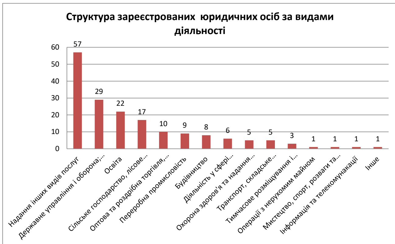
Рис.1. Структура за видами діяльності юридичних осіб на території Солотвинської селищної ради станом на 01.09.2025 року

Відповідно до інформації з аналітичної платформи Clarity Hromada створеною командою Clarity Project за підтримки USAID / UK aid проекту «Прозорість та підзвітність у державному управлінні та послугах / TAPAS» і за сприяння Міністерства цифрової трансформації України, станом на 01 вересня 2025 року на території Солотвинської територіальної громади функціонує 633 фізичних осіб -підприємців та 189 компаній- юридичних осіб, які є платниками податків до місцевого бюджету.