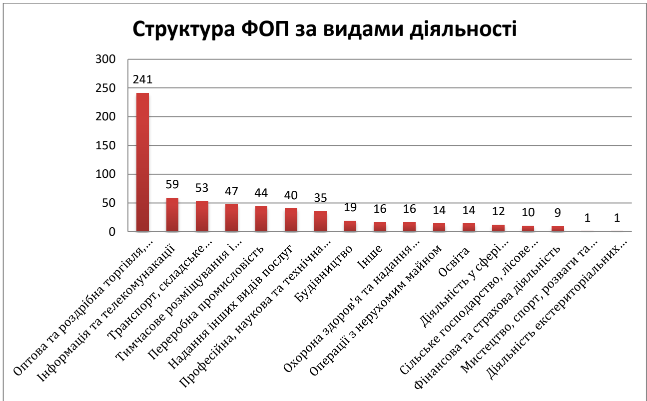
Рис.2. Структура за видами діяльності ФОП на території Солотвинської селищної ради станом на 01.09.2025 року