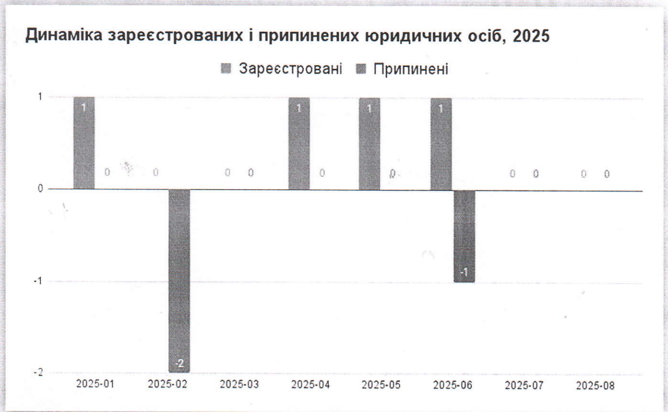
Рис.4. Динаміка реєстрації та закриття бізнесу юридичними особами на території Солотвинської селищної ради за 2025 рік