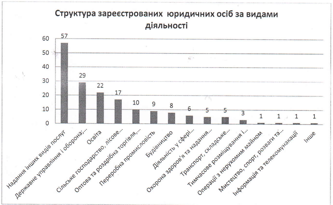
Рис.1. Структура за видами діяльності юридичних осіб на території Солотвинської селищної ради станом на 01.09.2025 року

Відповідно до інформації з аналітичної платформи Clarity Hromada створеною командою Clarity Project за підтримки USAID / UK aid проєкту «Прозорість та підзвітність у державному управлінні та послугах / TAPAS» і за сприяння Міністерства цифрової трансформації України, станом на 01 вересня 2025 року на території Солотвинської територіальної громади функціонує 633 фізичних осіб -підприємців та 189 компаній- юридичних осіб, які є платниками податків до місцевого бюджету.