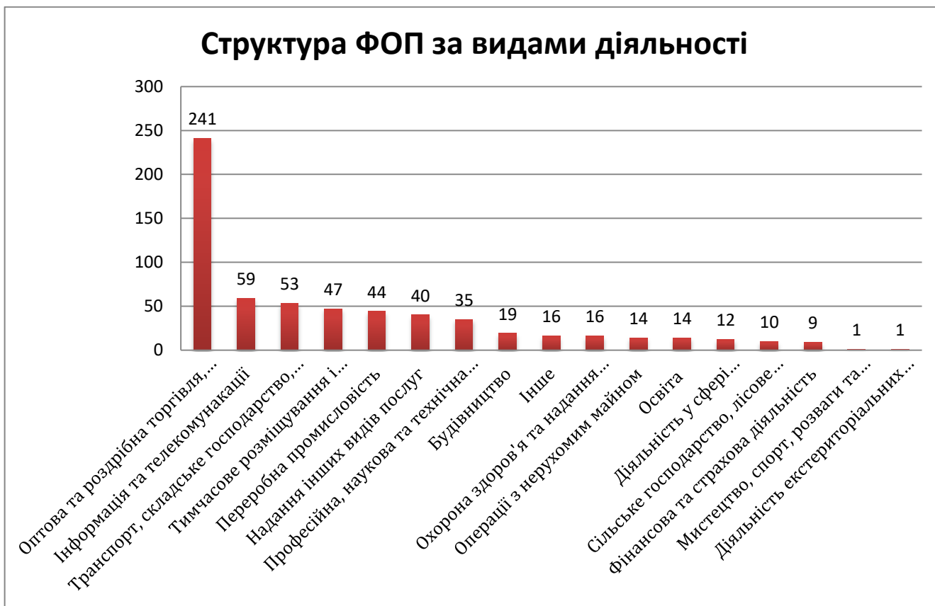
Рис.2. Структура за видами діяльності ФОП на території Солотвинської селищної ради станом на 01.09.2025 року