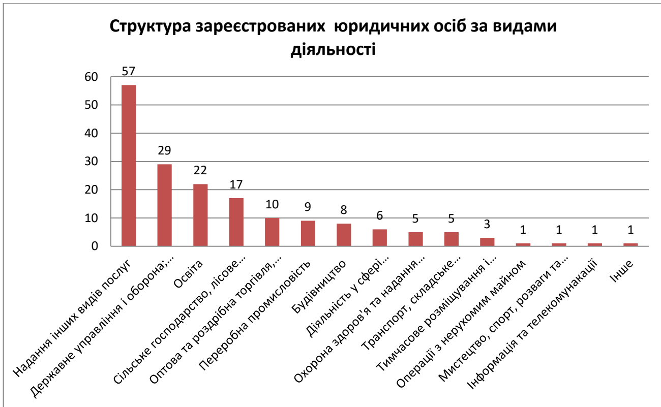
Рис.1. Структура за видами діяльності юридичних осіб на території Солотвинської селищної ради станом на 01.09.2025 року

сприяння Міністерства цифрової трансформації України, станом на 01 вересня 2025 року на території Солотвинської територіальної громади функціонує 633 фізичних осіб -підприємців та 189 компаній- юридичних осіб, які є платниками податків до місцевого бюджету.