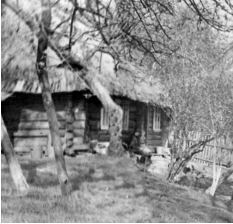
Житло, в якому була аптека австро-угорського Війська