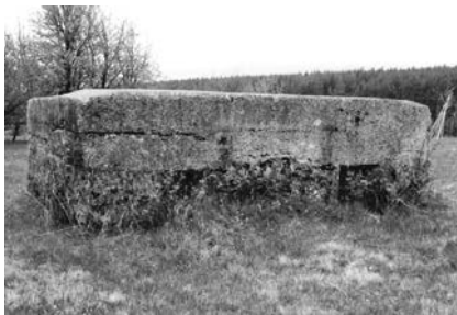
Перший дот в частині села «Лазы» в урочищі «Рогачинка» (закінчення вулиці Князевича)

До третього дота, іменованого «Паламентом», потрібно піднятися високо в гори (урочище «Підпогари»). Розташування його — приблизно 700 метрів над рівнем моря. Цей дот є дуже рідкісним на теренах Прикарпаття. Будувався він у найважчих умовах і до нього веде тільки вузька лісова стежка. Триповерховий дот має форму півкруга, повернутого до стрімкого схилу. Цікаво, що бійниці були розташовані на трьох рівнях — поверхах. Верхній ярус має дещо менший діаметр, ніж нижні. Із середнього ярусу стріляли лежачи, бо його висота становила близько метра. Висота укріплення становить 6 метрів. Видимість з цієї місцевості охоплювала найбільшу частину навколишніх сіл: Пороги, Маняву, Кричку, Яблуньку, Кривця, Раковця, Солотвина, Луквицю і Міжгір'я. Справа від вхідного отвору — таблиця з надписом, в якому вказано назву дота, час