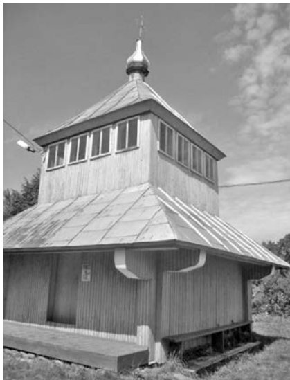
Дзвіниця, як оберіг, біля могил австро-угорських вояків в с. Богрівці

Після закінчення бойових дій богрівчани повернулися в своє рідне село та відбудували його. До речі, уряд виділив безплатно матеріал для будівництва — по 20 куб. лісу на кожне господарство. У 1927 році польський уряд зобов'язав селян, заплативши їм певну суму, зібрати останки австро-угорських вояків по селі і перепоховати їх на цвинтарі біля церкви. Люди зносили прах загиблих в плетених з лози кошелях, підвозили на возах. На цвинтарі, біля церкви, в одну могилу ховали (складали у целофанові пакети) прах 3—5 осіб. Цю роботу