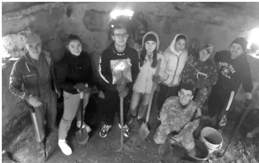
Впорядкування території дота «Паламент». Осіння толока. Студенти Прикарпатського національного університету ім. Василя Стефаника