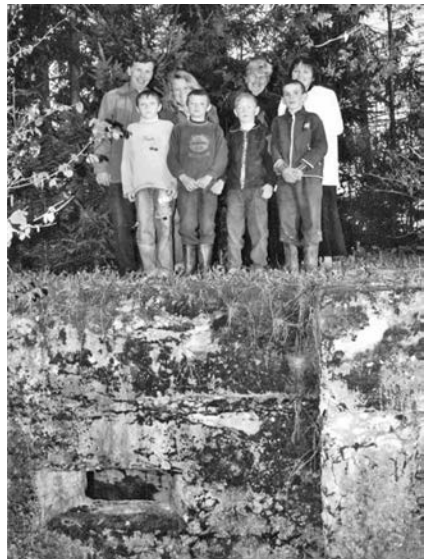
Восьмий і дев'ятий доти