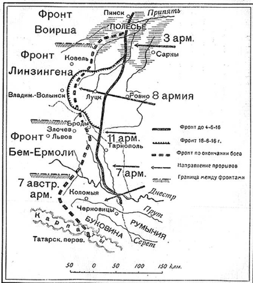
Схема № 7

Энциклопедич. Словарь Русск. Библиогр. Инст. Гранат.