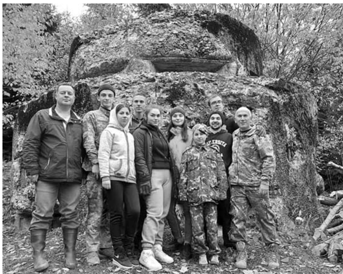
Осіння толока. Викладачі та студенти Прикарпатського національного університету ім. Василя Стефаника