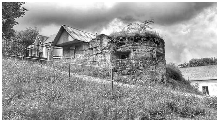
Дорога пам'яті до австро-угорського цвинтаря

офіцерській шинелі було знайдено добре збережену складену вчетверо австро-угорську газету. На металевій баклазі був вказаний надпис: «1916 рік». Прах двох загиблих вояків перепоховали до австро-угорських могил.