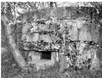
Другий дот в частині села «Лазы» в урочищі «Рогачинка»