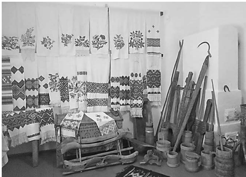
Музей побуту та етнографії в с. Богрівці

Приємним є той факт, що збереження історичної та культурної спадщини є одним із пріоритетних завдань керівництва Солотвинської територіальної громади.