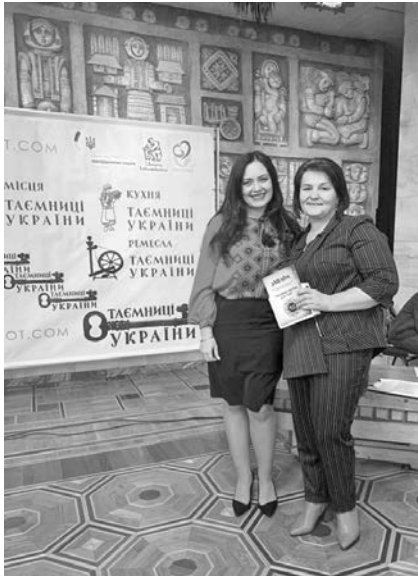
Приємні миті нагородження. Проект «Таємниці України для тебе»

Відчуття єдності поколінь, відчуття єдності родини, відчуття України несуть в собі талановиті люди чарівного гірського села Богрівки. Їх єднає одна земля, одне небо і одні стежки, одна пісня й одна вишиванка, одна любов до того краю, в якому народилися, який живить їх цілющими соками матінки-землі. Митці, спортсмени, різьбярі, ковалі, вишивальниці, пекарі — це далеко не весь перелік тих ініціативних, надзвичайно працьовитих, дружніх, талановитих людей, які є головним найбільшим багатством села, що творять свою долю і долю своїх дітей власними руками та в нелегких буднях засобами мистецтва зізнаються в любові рідній землі, переплітаючи у своїй