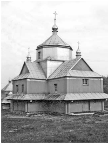
Церква Різдва Пресвятої Діви Марії