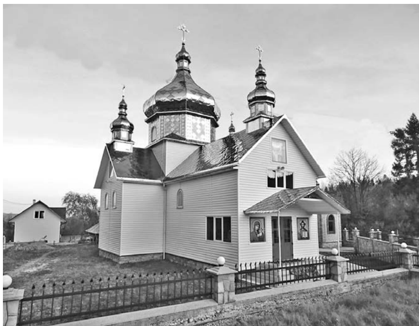
Церква Різдва Пресвятої Богородиці після реконструкції

Злетіли роки та відлетіли у вічність... Велика війна 1914–1918 рр. залишила по собі значні втрати, біль, страждання. Хочеться, щоб такі важкі часи не повторювалися більше ніколи, а майбутні покоління знали, заради чого живуть на цій землі. Хочеться, щоб унікальні пам'ятки, які були «свідками» тих далеких подій, зміцнювали в наших серцях любов до України, рідного краю, історичної та культурної спадщини, вселяли нам надію і розуміння того, що найважливіше у цьому житті — мирне небо над головою, взаємодопомога, взаєморозуміння, віра в Бога і Україну.