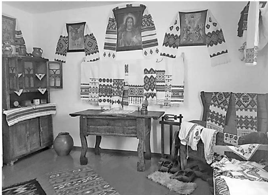
Музей побуту та етнографії в с. Богривці

Існує думка, що історія — щось далеке від нас, таке, що давно минуло. Ні, історію творимо ми — повсюди і щогодини. День, прожитий кожним із нас сьогодні, завтра стане історією — історією сучасності. І з того, яким був цей день, чим він був насичений, про нас судитимуть наші нащадки. Ми ж, ті, хто живе нині, відповідальні як за минуле, так і за майбутнє. Відповідальні перед тими, хто творив підвалини нашої державности. Наша подвійна відповідальність перед тими, хто прийде після нас, адже успадкують вони не тільки наше сьогодні, а й минуле.