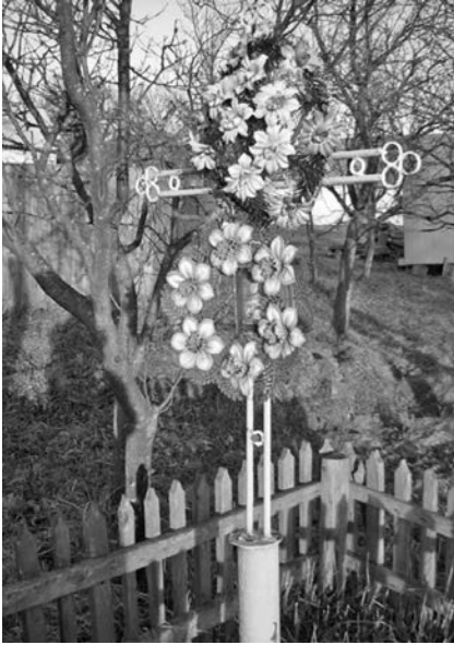
Хрест австро-угорським воякам на вул. Т. Шевченка

по вул. Шевченка), і сьогодні є залізний хрест на місці могили, де були поховані австро-угорські воїни. Пізніше їх останки забрали родичі з Коломиї і, напевне, там їх перепоховали.