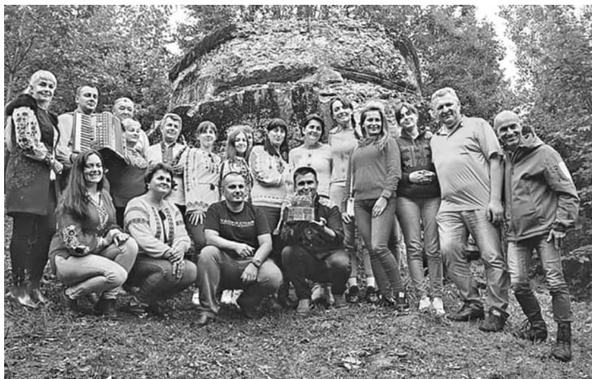
Світлина на згадку учасників проєкту «Таємниці України для тебе»