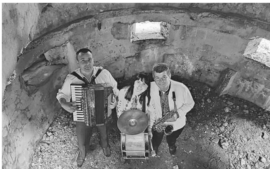
Замість австро-угорських вояків гостей біля дотів зустрічають народні музиканти. Гурт «Нова кантора»