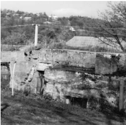
Четвертий дот в центральній частині села «Долини» біля церкви Різдва Пресвятої Богородиці

За словами старожилів, центр села російські війська атакували найбільше. Тут були розташовані військовий госпіталь, аптека, кухня, штаб-квартира, де проживали лікарі, командири австро-угорської армії.