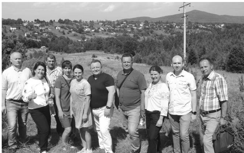
Туристичний форум. Практична частина. Учасники панельної дискусії «Актуальні перспективи розвитку зеленого туризму в Солотвинській територіальній громаді» в рамках дискусійного майданчика «Стратегія Прикарпаття 2050»