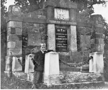
Пам'ятник загиблим у Першій світовій війні, який був знищений нацистами під час Другої світової війни в селищі Солотвині

братській могилі захоронено хорватських воїнів 25-го Загребського і 26-го Карловацького полків австро-угорської армії у кількості 51 особа. До війська були мобілізовані і місцеві жителі околиць. Більшість із них перебували в складі Легіону Українських січових стрільців.