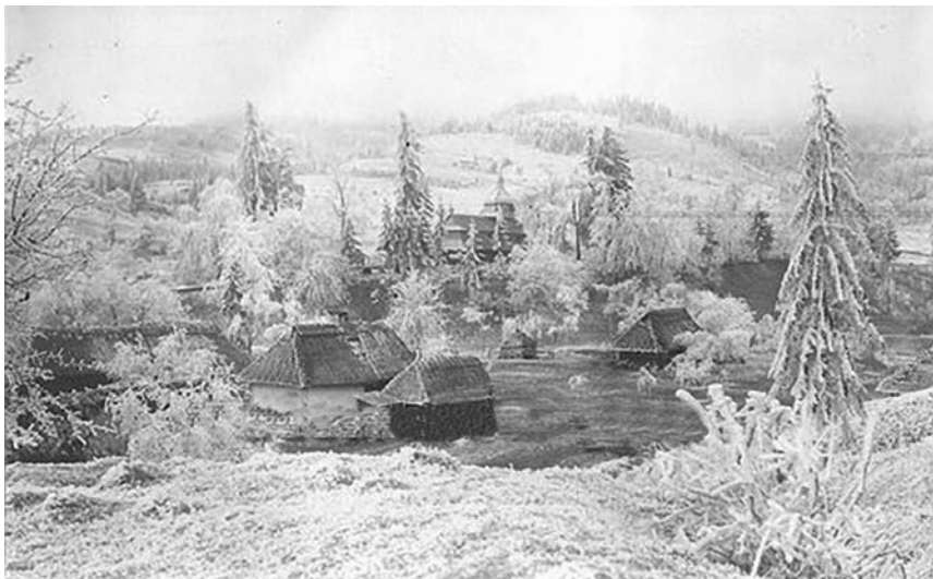
Церква Святої Трійці в 1916 р.

Ц ерква — це святиня для тих, кому загрожує розбиття, це скарб, це змозі збагатити кожного, це дуже успішний лік на хвороби, це засіб духовного злету людини. Ще від початків прийняття християнства люди потребували єднання з Богом, і це єднання відбувалося в Божому храмі, де кожна ікона, кожна річ нагадує про високі почуття.