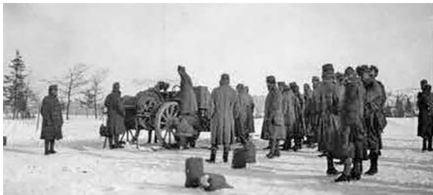
Австро-угорські війська у с. Лесівці на Богородчанщині.