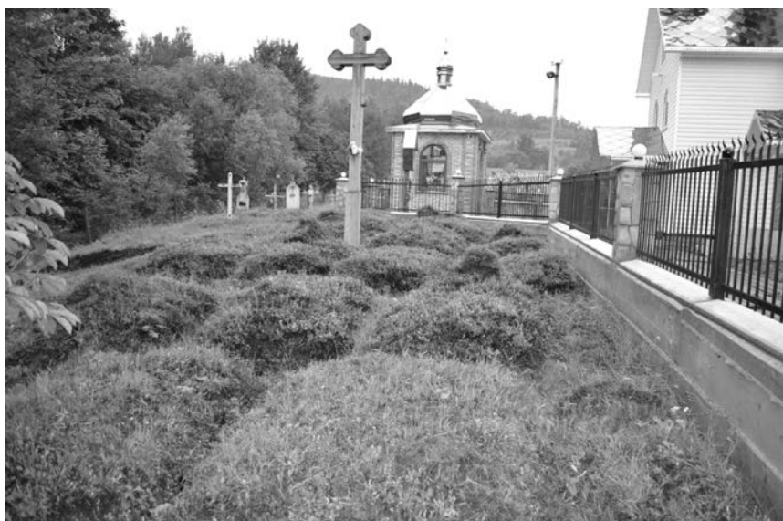
Могили австро-угорських вояків