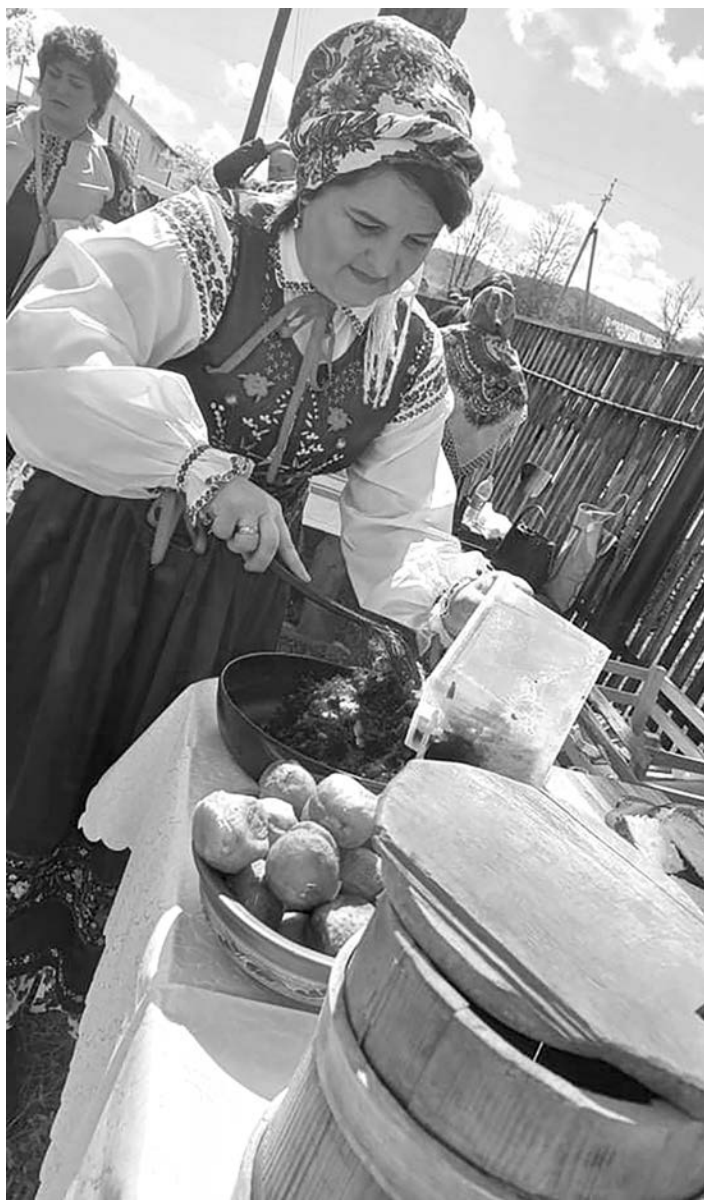
Фестиваль Борщу в Солотвинській територіальній громаді. Приготування богрівського борщу