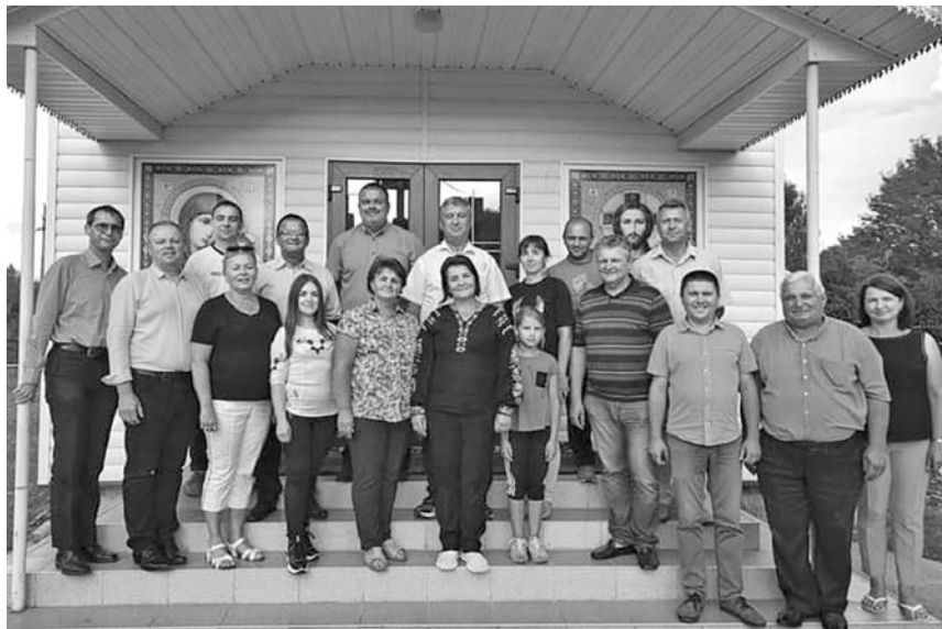
Світлина на згадку з угорськими гостями