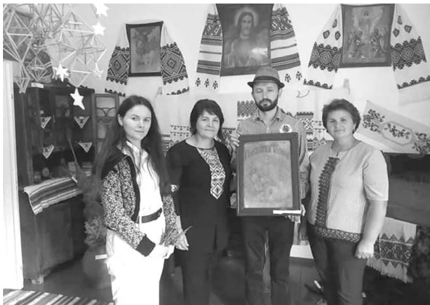
В гостях журналісти телебачення Суспільне Карпати.